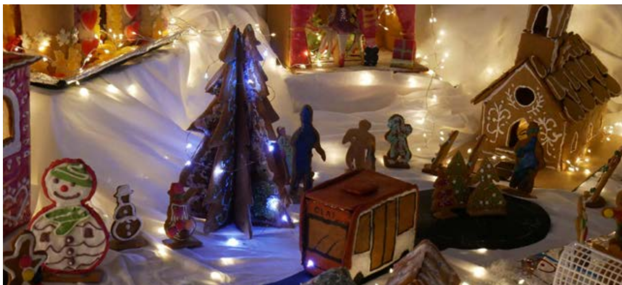
Pepperkakebygda i Førde.

Vi ser at det vil ta tid før autonomi endrar samfunnet i ønskt retning og at det krev at mobilitetsaktørane er villige til å investere i innovasjon og uttesting for å komme dit.