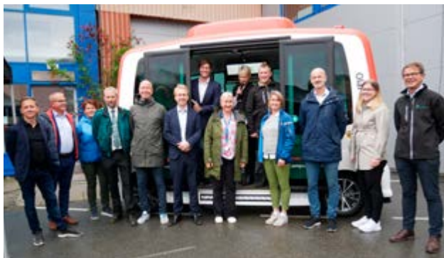
Alle prosjektdeltakerne foran bussen på opningsdagen