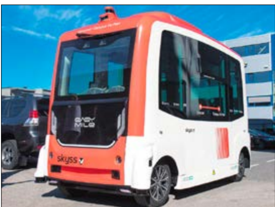
FERDIG: Provedet for den sjølvkjørende bussen i Førde er over.